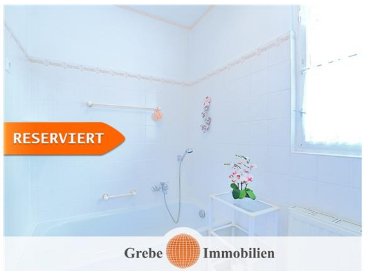
Bad im OG mit Wanne...