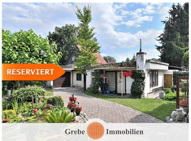
Garage und Nebenglass