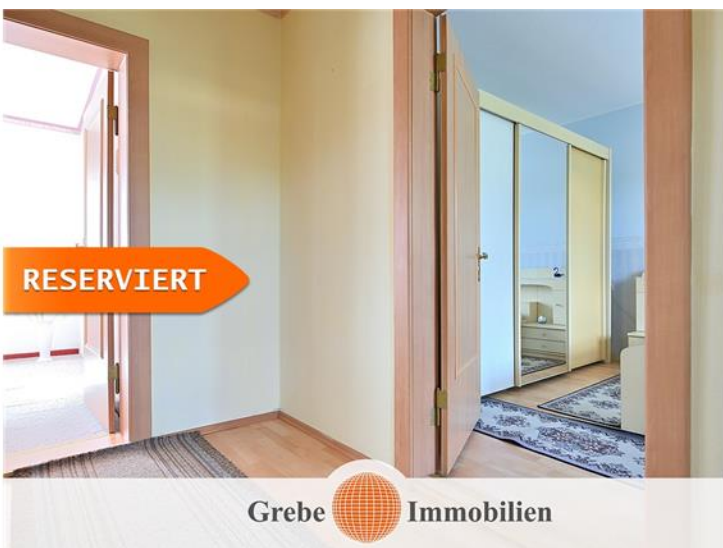
Flur im OG Bild 2