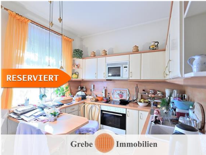
Küche im EG