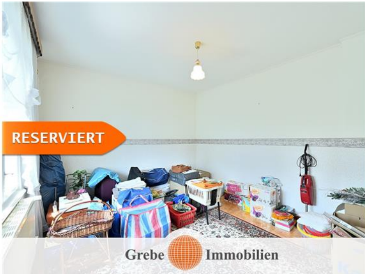
3. Zimmer im OG Bild 2