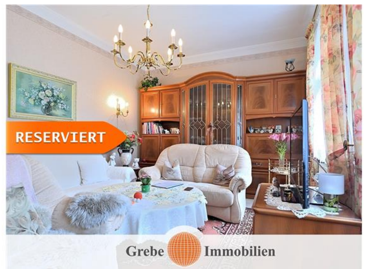
Wohnzimmer im EG Bild 2