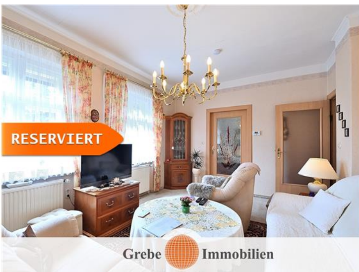
Wohnzimmer im EG