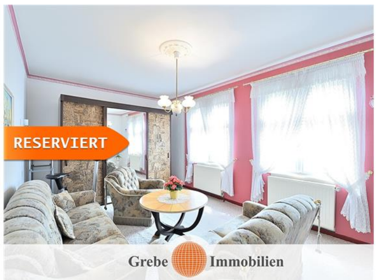
Wohnzimmer im OG