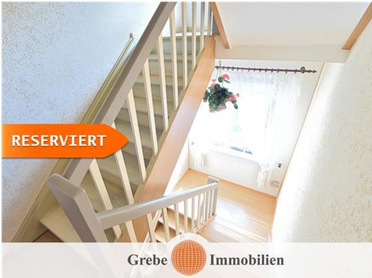
Treppe zwischen EG und OG