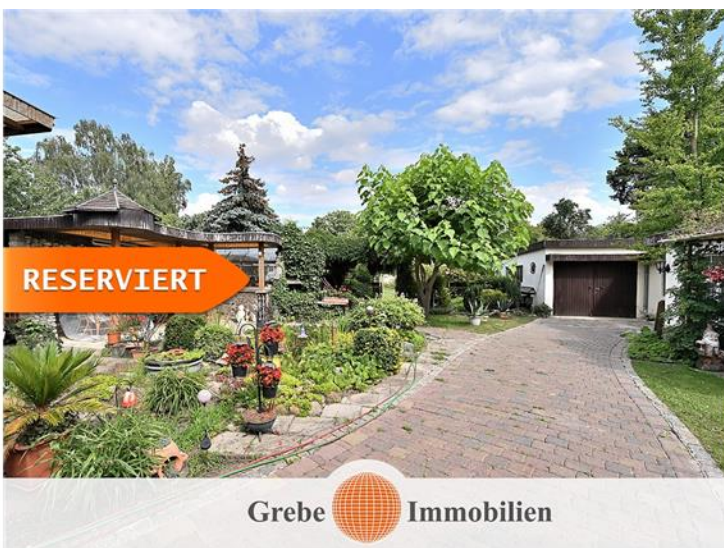
Zufahrt zur Garage