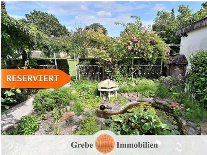
Teich im Grünen