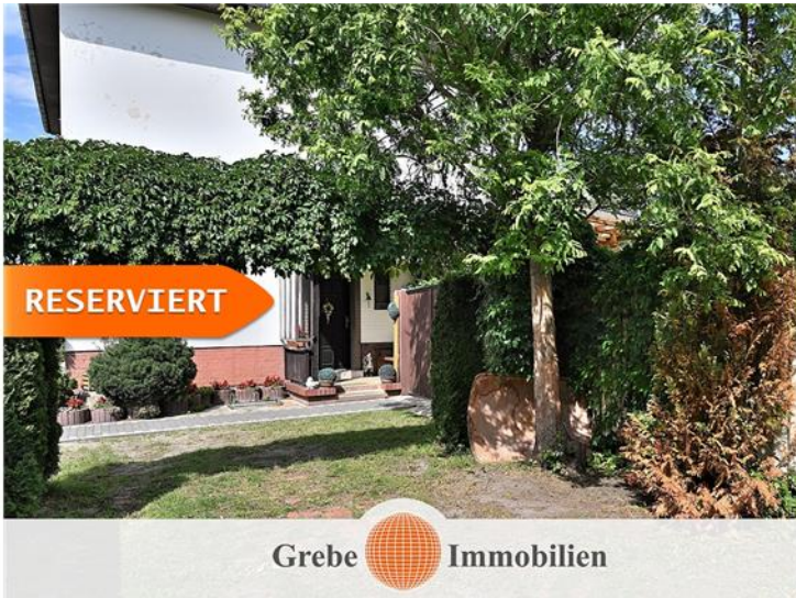
Stellplätze neben dem Haus