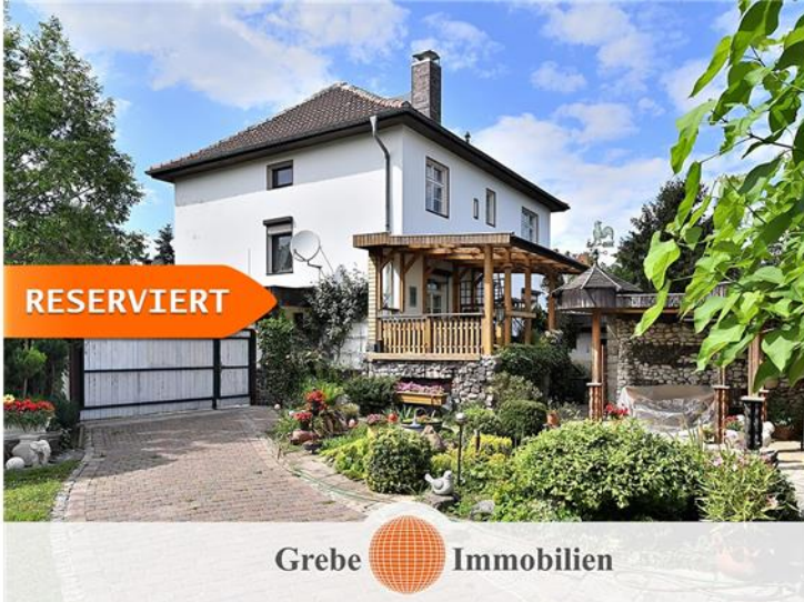
Terrasse am Haus