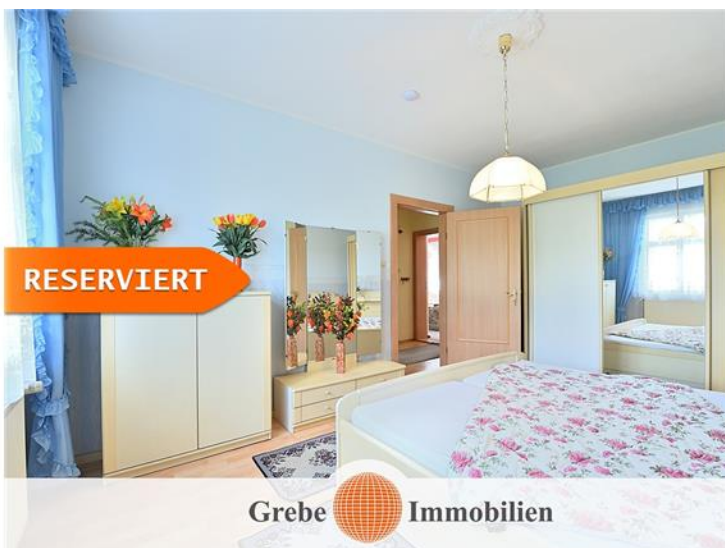
Schlafzimmer im OG Bild 2