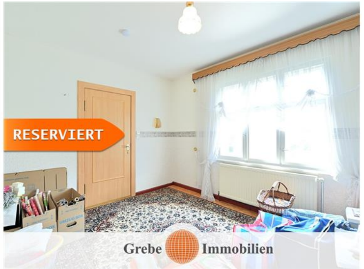
3. Zimmer im OG