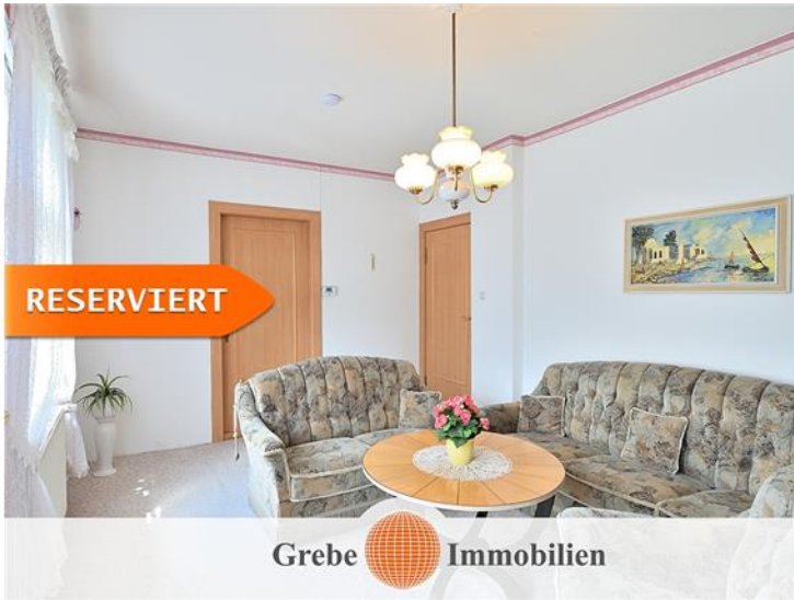
Wohnzimmer im OG Bild 2