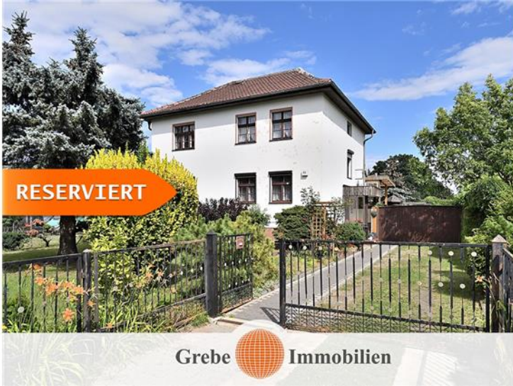
Zufahrt zum Grundstück